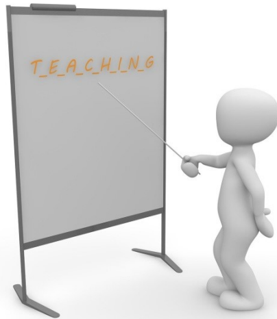
Με φυσική παρουσία